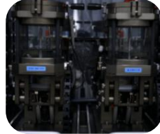
試験動画は QR へ

真水・塩水・塩素水・汗で濡れてもそのまま使用可能。補聴器に水が染み入らないようコーティングやシーリングでハウジング強化。