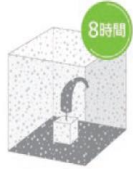
防塵テスト 8 時間

真水であれば濡れても乾燥させれば、再び音が出力され直接的な故障にはつながらない。